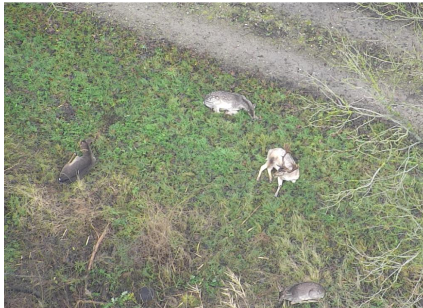
Roedeltje damherten in perceel 5ZFL.

Dit voorjaar is een vervolgonderzoek gestart, waarbij wordt onderzocht of met behulp van computermodellen de warmtebeelden op soort gebracht kunnen worden. Uiteraard werkt de SFF hier weer van harte aan mee.